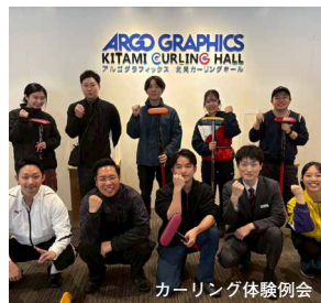
カーリング体験例会