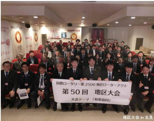
地区大会 in 北見

今後も様々な活動を通じて会員みんなが成長できる1年にしたいと思いますので、引き続き北見ローターアクトクラブのことをよろしくお願い申し上げます。