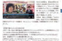
苦勞があったからこそ取り上げてくれるメディア