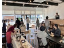
北海道内の作家を呼んで・地域のひとへの楽しみ提供