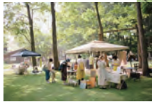
コロナ禍の楽しみ提案と作り手とのつながりを活かした企画