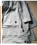
袖丈も含め微調整