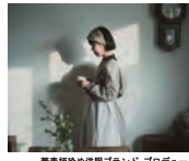
精美縫製の洋服ブランド プロデュース

精美縫製プロジェクト〜様市内の町おこし・衣責任製品をつくり循環型社会を提案するTodaiki