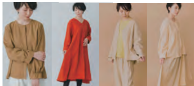
ご購入ありがとうございました