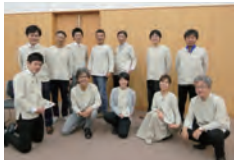
十勝イノベーションプログラム事務局制服